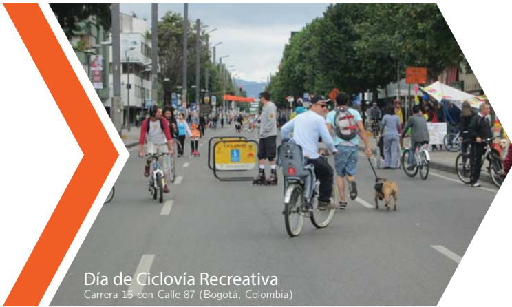
Día de Ciclovía Recreativa Carrera 15 con Calle 87 (Bogotá, Colombia)