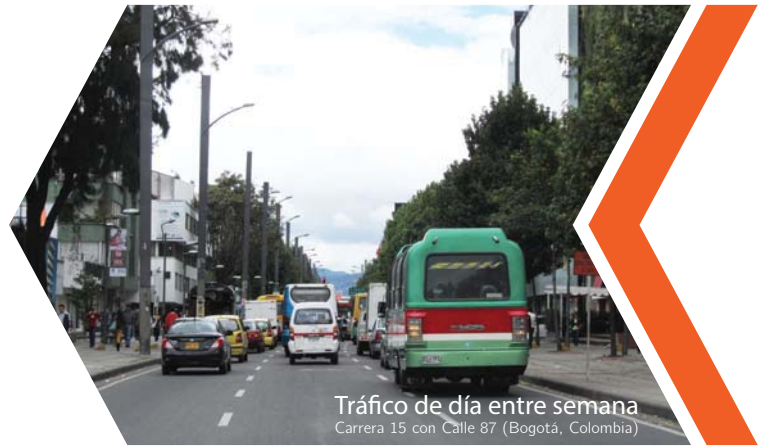
Tráfico de día entre semana Carrera 15 con Calle 87 (Bogotá, Colombia)