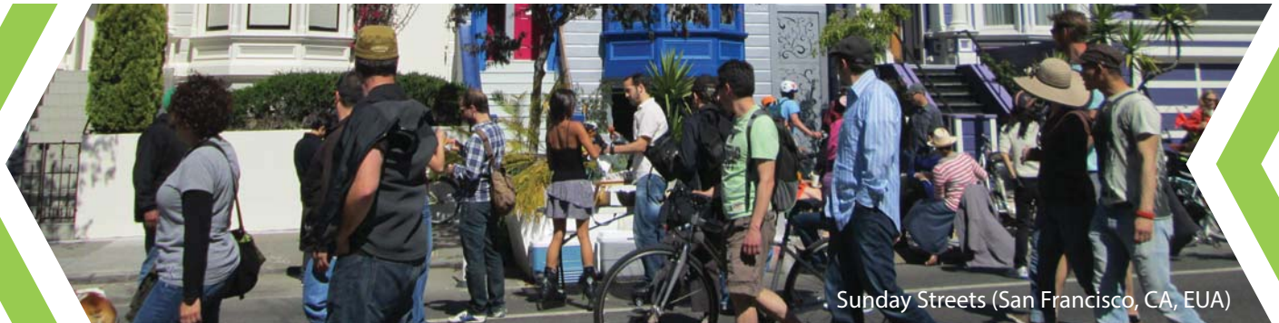
Sunday Streets (San Francisco, CA, EUA)